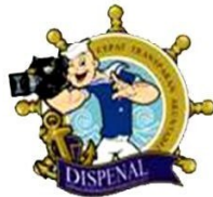
Gambar 3. Logo Dispenal Lama