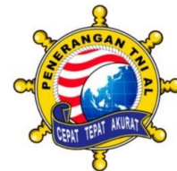
Gambar 4. Logo Dispenal Baru

Berdasarkan analisis semiotika Charles Sanders Peirce dengan model triadic dan konsep trikotomi, representamen , interpretant , dan object , logo Dispenal mencerminkan identitas dari TNI AL dan merupakan tanda yang dapat mewakili pikiran masyarakat terhadap TNI AL. Tanda-tanda yang dibahas dalam penelitian ini terbatas pada ikon, indeks, dan simbol berdasarkan semiotika Peirce. Ikon dalam logo Dispenal antara lain kemudi, dan lencana perang. Indeks dalam logo Dispenal itu antara lain bola dunia, kemudi kapal bertuliskan “Penerangan TNI AL”, lencana perang merah putih, dan pita seperti gelombang bertuliskan “Cepat Tepat Akurat”. Sedangkan Simbol dalam logo Dispenal antara lain warna kuning, merah putih, biru.